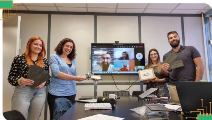
Athens, Greece 07/10/2022